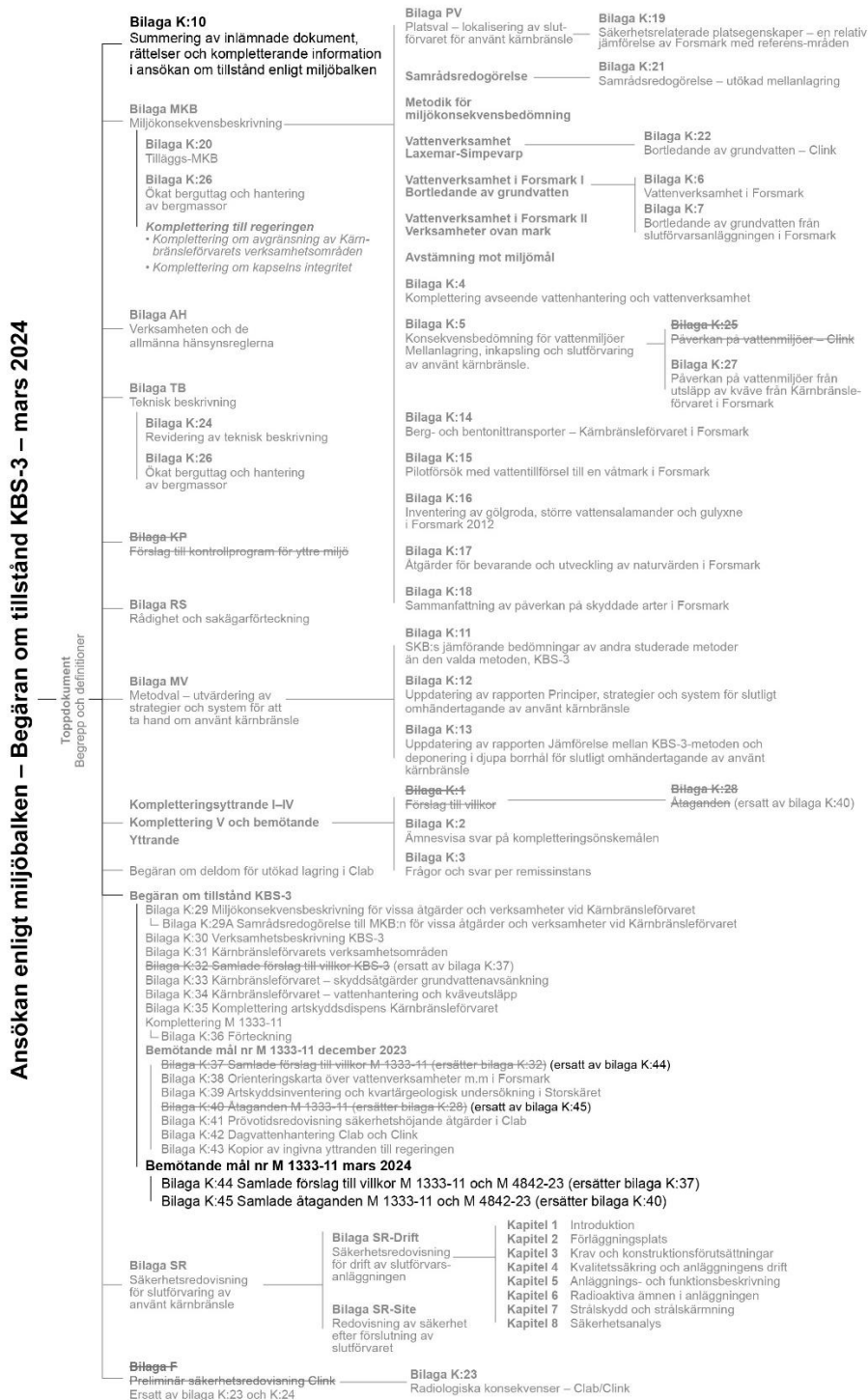
Figur 1-1. Samliga dokument inlämnade i ursprunglig ansökan samt i kompletteringarna, inklusive till Miljödepartementet 2019. Vidare ingår begäran om deldom för utökad mellanlagring i Clab, begäran om tillstånd för KBS-3, och med svart text Bemötande på remissinstansernas yttranden. Överstrukna dokument har utgått.

I bilaga 1 presenteras hänvisningar till SKB:s svar på remissinstansernas kompletteringsönskemål till och med komplettering IV sorterade efter de ämnesområden som önskemålen berört.