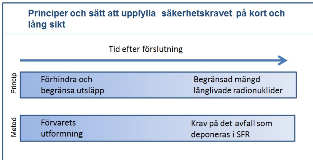
Figur 2. Säkerhetsprinciper och sätt att uppfylla säkerhetskravet på kort och lång sikt. På kort sikt är utformningen av förvaret viktigast. På lång sikt, när barriärerna har degraderats, baseras säkerheten på att mängden långlivade radionuklider är begränsad.

På lång sikt kommer de tekniska barriärerna att degraderas. Då är radioaktiviteten försumbar för kortlivade radionuklider och den risk som återstår är från långlivade radionuklider. En viktig säkerhetsprincip är därför att begränsa mängden långlivade radionuklider som deponeras i SFR. Säkerhetsprinciper och på vilka sätt som säkerhetskravet uppfylls på kort och lång sikt illustreras i figur 2.