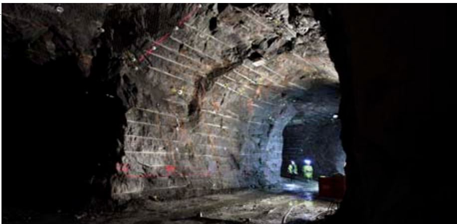
I tunneltaket syns borrpiporna efter skonsam sprängning i Äspölaboratoriet.

andra ceremonier i Matteus kyrka, som ligger alldeles intill bygget.