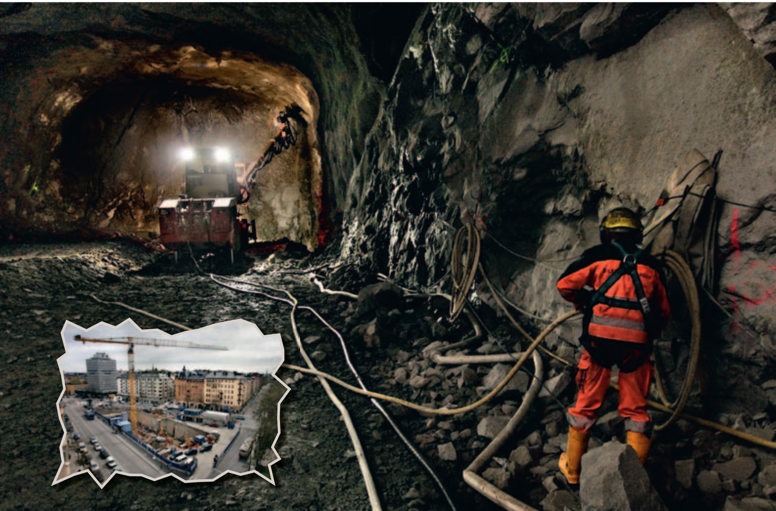
Nya tunnlar sprängs ut i berget under Stockholm för Citybanans räkning. Vid Odenplan (insprängd bild!) pågår sprängningar för en ny nedgång och en ny pendeltågsstation i berget.