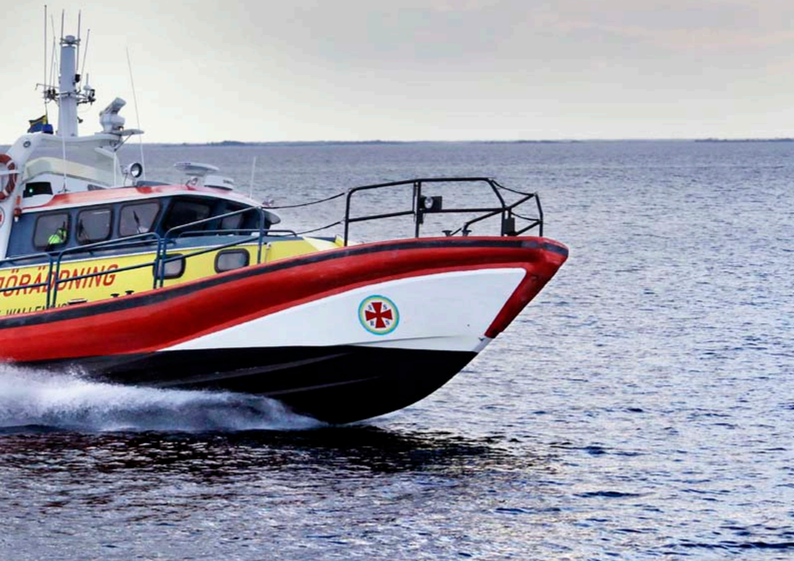
Både Olof Wallenius II och den mindre räddningsbåten Rigoletto kan komma upp i en maxhastighet av 34 knop.

Utbildningen och tillgången till förstklassig utrustning är en av de saker som lockar med uppdraget. Och så umgänget förstås.